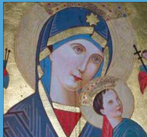
Gyergyószentmiklós – könnyező Szűzanya